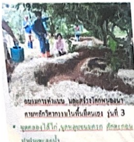
ชมรมการทอเบ็ด และสร้างโลกแห่งอนาคต ศูนย์ศึกษาธรรมชาติในพื้นที่ดินแดง รุ่นที่ 3 • จุดคลองไผ่ใต้, จุดหลุมขมหมึก สัตว์เคถอน และ ป่าไผ่ธรรมชาติ