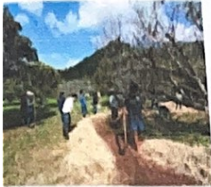
ชมรมการทอเบ็ด และสร้างโลกแห่งอนาคต ศูนย์ศึกษาธรรมชาติในพื้นที่ดินแดง รุ่นที่ 1 • จุดคลองไผ่ใต้, จุดหลุมขมหมึก สัตว์เคถอน และ ป่าไผ่ธรรมชาติ